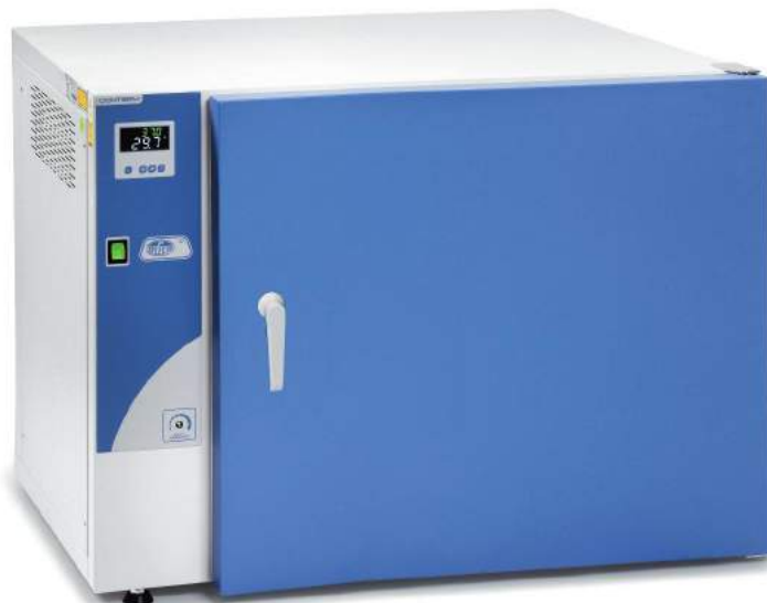
Modèle Conterm type Poupinel, codes 2000252 et 2000254.