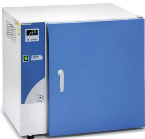
Modèles Conterm, codes 2000250, 2000251 et 2000253.

CARACTÉRISTIQUES, PANNEAU DE COMMANDES, SÉCURITÉ, NORMES ET ACCESSOIRES (voir pages 138 et 139).